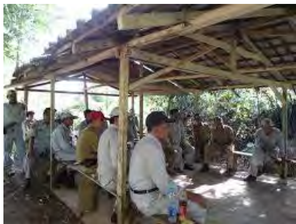
Gambar 4. Penerangan dari Penyuluh Kehutanan

Secara umum penyuluh kehutanan bertugas untuk memberikan penerangan kepada masyarakat wilayah hutan tentang “sesuatu yang belum diketahui dengan jelas” untuk dilaksanakan/ diterapkan dalam rangka peningkatan produksi dan pendapatan/ keuntungan yang ingin dicapai melalui proses pembangunan kawasan hutan, sesuai dengan tujuan penyuluhan kehutanan yang tertuang pada Undang-Undang nomor 41 Tahun 1999 tentang Kehutanan, pasal 56 yaitu: untuk meningkatkan pengetahuan dan ketrampilan serta mengubah sikap dan perilaku masyarakat agar mau dan mampu mendukung pembangunan kehutanan atas dasar iman dan taqwa kepada Tuhan Yang Maha Esa serta sadar akan pentingnya sumberdaya hutan bagi kehidupan manusia.