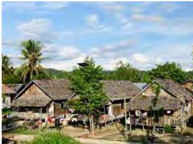
Gambar 2. Kehidupan Masyarakat di Sekitar Hutan

Pada kawasan hutan tersebut terdapat masyarakat yang hidup sebagai petani, pekebun, peternak, nelayan, pembudi daya ikan, pengolah ikan, beserta keluarga intinya. Penduduk yang bermukim di dalam dan sekitar kawasan hutan tersebut, sebagian besar kehidupannya bergantung pada keberadaan hutan. Secara umum kondisi infrastruktur, perumahan, pendidikan, dan kesehatannya lebih rendah dari masyarakat perkotaan. Tercatat penduduk yang bermukim di dalam dan sekitar kawasan hutan tercatat sebanyak 48,8 juta jiwa, dan sekitar 10,2 juta jiwa diantaranya tergolong miskin (CIFOR, 2000 dan BPS, 2000)