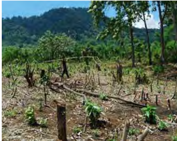
Gambar 5. Penebangan Hutan oleh Manusia