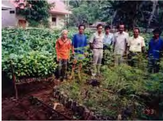
Gambar 3. Dukungan dari Penguluh Kehutanan Profesional

Secara umum penyuluh kehutanan bertugas untuk memberikan penerangan kepada masyarakat wilayah hutan tentang “sesuatu yang belum diketahui dengan jelas” untuk dilaksanakan/ diterapkan dalam rangka peningkatan produksi dan pendapatan/ keuntungan yang ingin dicapai melalui proses pembangunan kawasan hutan, sesuai dengan tujuan penyuluhan kehutanan yang tertuang pada Undang-Undang nomor 41 Tahun 1999 tentang Kehutanan, pasal 56 yaitu: untuk meningkatkan pengetahuan dan ketrampilan serta mengubah sikap dan perilaku masyarakat agar mau dan mampu mendukung pembangunan kehutanan atas dasar iman dan taqwa kepada Tuhan Yang Maha Esa serta sadar akan pentingnya sumberdaya hutan bagi kehidupan manusia.