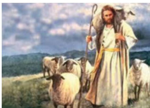
Sumber: Sang Gembala Gambar 6.2 Yesus Gembala yang baik

Kami semua adalah milik-Mu! Domba korban segala umat manusia Domba yang berlutut di taman Zaitun Domba yang dibantai dan bangkit dari kematian Domba yang duduk di kanan Bapa Domba anak dari segala terang Domba yang manis, domba kami semua Lapangkanlah dada-Mu, ya Domba Kudus. Limpahkanlah berkat-Mu bagai air Meluaplah ampun dari samudera kasih-Mu Kami semua adalah milik-Mu Pengkhianat, penjinah, perampok Pembunuh, pendusta dan pemberontak. Lapangkanlah dadaMu, Ya Domba Kudus!