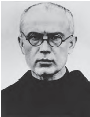
Gambar 5.1 St. Maximilian Kolbe

Kaul kebiaraannya yang pertama diucapkannya pada tahun 1911. Sebagai seorang biarawan Fransiskan, Maximilian dikenal sebagai seorang yang saleh. Pada tahun 1917, ia mendirikan Militia Maria Immaculata di Roma untuk memajukan kebaktian kepada Bunda Maria yang dikandung tanpa noda. Pada tahun 1918, Maximilian ditahbiskan menjadi imam dan kemudian kembali ke Polandia untuk berkarya disana. Di Polandia, ia menyebarkan berbagai tulisan tentang Bunda Maria dalam buletin 'Militia Maria Immaculata'. Selain itu ia mendirikan biara di Niepokalanov pada tahun 1927 untuk memberi tempat pada 800 biarawan. Biara yang sama didirikannya di Jepang dan India. Dikemudian hari, ia menjadi superior sendiri. Itulah sekilas kebesaran dan karya Maximilian.