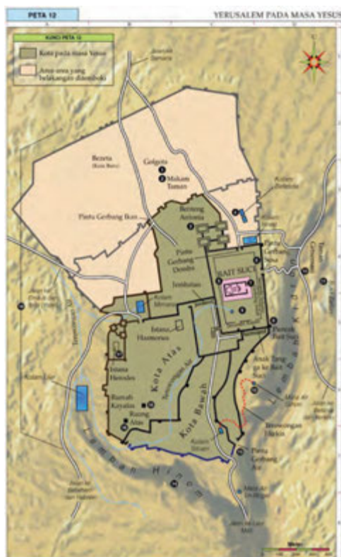
Gambar 4.2 Yerusalem pada masa Yesus

Dalam masyarakat Yahudi, fungsi religius melampaui jangkauan kehidupan beragama. Fungsi ini juga merambah dalam bidang lain seperti ekonomi, sosial, dan politik. Itulah sebabnya tidak mungkin bertindak dalam bidang agama tanpa sekaligus bertindak di bidang lainnya. Contoh: bila Yesus membela kaum miskin, kita harus mengetahui siapakah yang disebut kaum miskin di Palestina pada waktu itu. Demikian juga perlawanan Yesus terhadap kaum Saduki dan Farisi tidak boleh diartikan sebagai pertentangan dalam konsep keagamaan saja. Begitu juga pilihan para rasul mempunyai arti simbolis dalam hal seperti itu sebenarnya menjadi gejala umum. Ketika suatu bangsa tertindas, hampir sebagian besar orang merindukan kedatangan tokoh yang bisa membebaskan rakyat dari jeratan penindasan itu. Untuk itu, gambaran situasi dan latar belakang ketika Yesus mewartakan Kerajaan Allah sangat mempengaruhi perkembangan, begitu juga tekanan, gugatan, dan halangan tentang bagaimana perjuangan-Nya itu.