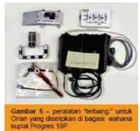
Gambar 5 – peralatan “terbang.” untuk Orlan yang diselipkan di bagasi wahana suplai Progres 19P

10 September 2005: Progress 19P merapat dan docking ke ISS. Dengan ini berakhirilah rentetan panjang proses kerja gropyokan di