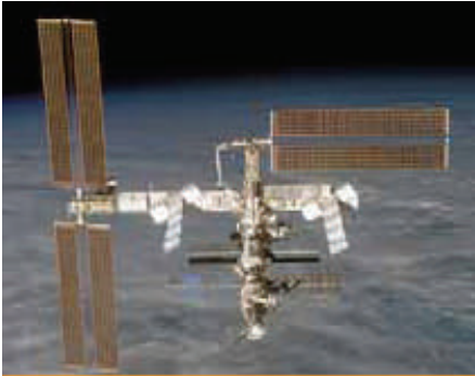
Gambar 7 - ISS (International Space Station) mengagung megah di orbit +/- 200 mil dari muka bumi

monot dan astronaut (yang) radio amatir dari berbagai Negara, yang ikut jadi awak Ekspedisi di ISS.