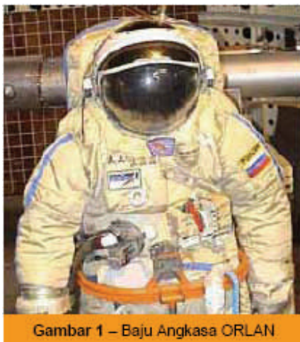
Gambar 1 – Baju Angkasa ORLAN

Untuk bisa “bunyi”, baju-angkasa Orlan bikinan Rusia tersebut (Gambar 1) dilengkapi dengan 3 buah batere, sebuah pemancar (HT Kenwood TH-K2 sumbangan Ken-