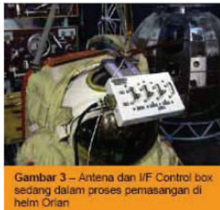
Gambar 3 – Antena dan I/F Control box sedang dalam proses pemasangan di helm Orlan

Sebelum dilepas ke orbit, awak ISS ( Internatonal Space Station , dari-